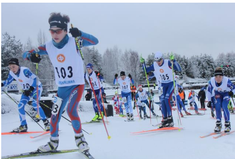
Nuorten SM-kilpailujen M14-sarjan vauhdikas lähtökiihdytys Ahvenistolla.